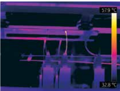
Cable de alimentación de transformador caliente